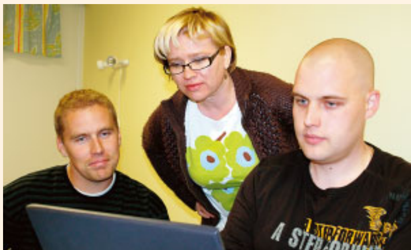
Osa asunto-osakeyhtiön Serkun Salpan hallituksen jäsenistä tutkii mielenkiinnolla tuoreita Avain!-tutkimustuloksia.

Seuraavaksi Hakuninmaalla järjestetään asukasilta, jossa tutkimustuloksia